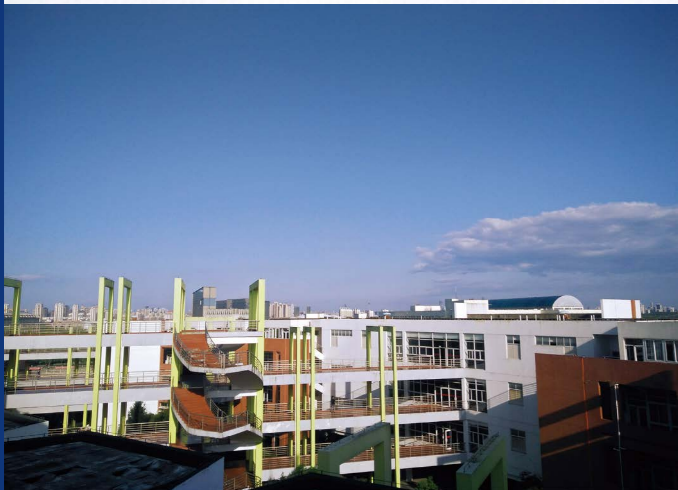
午后云 摄/蒋艺晨 法学院知识产权151班