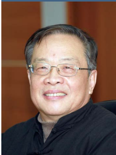
陈东有 南昌大学江医宿舍读书会指导老师

1952年11月出生于江西省南昌市。三十多年来一直从事中国古代文学史、汉语史、中国文化史、海洋社会经济史和管理学的教学与研究。2005年起担任南昌大学博士生导师。发表学术论文90余篇。2002年11月任中共南昌大学党委副书记；2003年5月任中共江西省委宣传部副部长，2007年9月任常务副部长，2013年5月起任江西省人大内务司法委员会副主任委员。现为南昌大学教授、博士生导师。